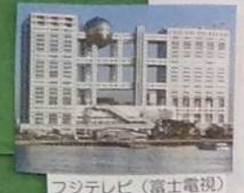
フジテレビ (富士テレビ)