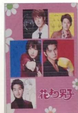
※これは「花より団子」派