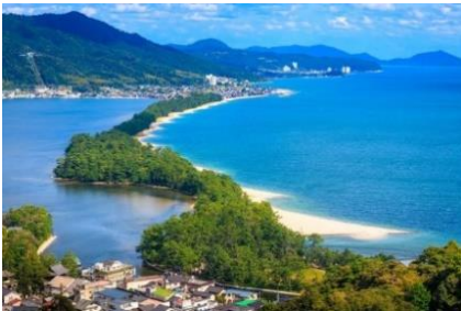
天橋立（京都府宮津市）

天橋立は全長3.6 kmの砂州 ます で約6700本の松 ほん が生 まつ い茂 お る珍 しげ しい地形 めづら です。天橋立は歩 あまのはしだて いて渡 ある ることができます。他 ほか にも船 ふね に乗 の ったり、海 うみ で泳 およ いだりできます。