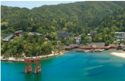
宮島（広島県廿日市市）

宮島には厳島神社 いつくしまじんじや があります。特 とく に有名 ゆうめい なのは厳島神社の大鳥居 いつくしまじんじや おおとりい で、高 たか さは16.6mあります。鳥居 とりい は海 うみ にあって、干潮時 かんちょうじ には鳥居 とりい まで歩 ある いて行くことができます。